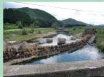
津和野被害状況 (橋が流され線路のみになりました)

7月の津和野・須佐、 8月の江津の水害と 2013年夏の山陰西部は 異常気象でした。