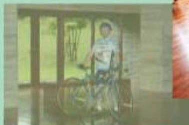
グッドショット！