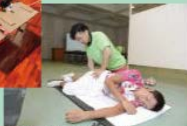
スポーツマッサージ by 佐久間道浩氏