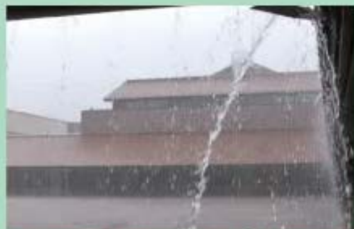
台風15号直撃の大会当日 スタート・フィニッシュ地点 (島根芸術文化センターグラントワ)

7月の津和野・須佐、 8月の江津の水害と 2013年夏の山陰西部は 異常気象でした。