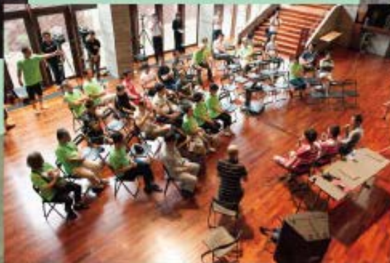
イケメン対談 by 浅田監督、相川プロ、RENさん