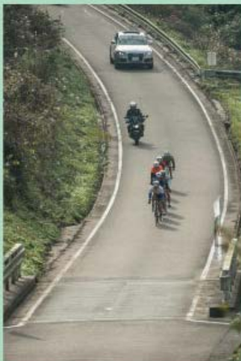
協賛頂いているアウディ様提供のRVカーとワゴンが審判車として活躍しました。

島根県西部では、初めての自転車ロードレース大会、そして、苦勞して得た一般公道全面通行止めの中、15歳から18歳までの少年達が日頃の鍛錬の成果を披露しました。