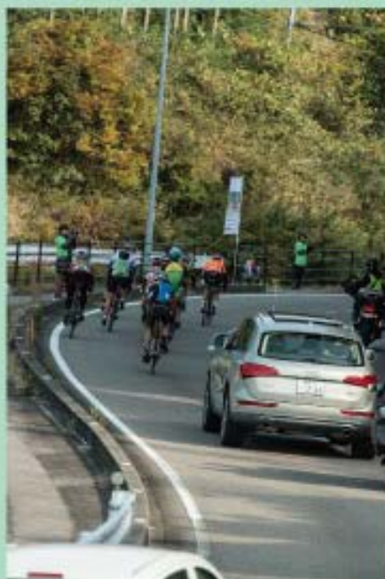
全面通行止めの公道を選手達が競い合います。