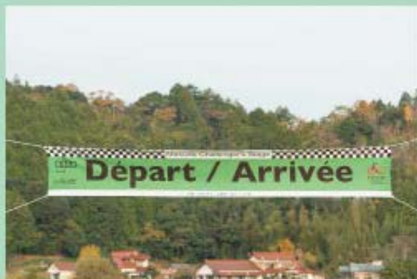
スタート・フィニッシュ地点。赤レンガの家並みが、まるでヨーロッパみたいです。

島根県西部では、初めての自転車ロードレース大会、そして、苦勞して得た一般公道全面通行止めの中、15歳から18歳までの少年達が日頃の鍛錬の成果を披露しました。