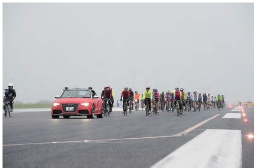
萩・石見空港滑走路走行風景