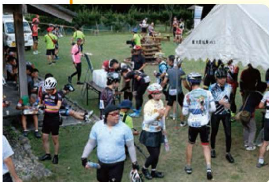
← ますだ 益田 INAKAライドのエイドステーション(島根県, 2018年)

ヨーロッパではツール・ド・フランスに代表される自転車レースが盛んで、駐輪スペースを備えた電車が走るなど、自転車は日常生活にとけ込んでいる。日本でも、通勤手段としての自転車利用や、長距離を走るロングラン、坂道を登るヒルクライムなどの自転車イベントが全国で開かれ、自転車文化が徐々に育まれてきた。グルメライドは、途中に設けられたエイドステーション(補給所)で土地の名産品を楽しみながら一定のルートを通る地域振興も兼ねたイベントである。