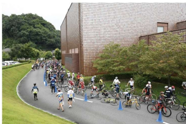
◎緊張のスタート前